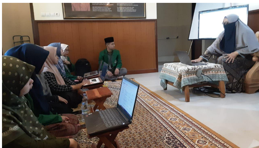
Gambar 3. Proses pendampingan pendaftaran merek oleh tim PkM UNU Surakarta

Keempat, masa pengumuman atau publikasi merek. Merek yang sudah lolos pemeriksaan formalitas akan masuk ke tahap publikasi atau pengumuman selama dua bulan. Pada tahap ini, merek dipublikasikan secara online melalui laman https://merek.dgip.go.id/publikasi-merek . Jika dalam dua bulan tidak ada keberatan dari masyarakat, maka merek akan diproses ke tahap pemeriksaan substantif. Namun jika ada keberatan dari masyarakat, maka pemohon akan menerima berita keberatan dan diberi kesempatan untuk memberikan sanggahan.