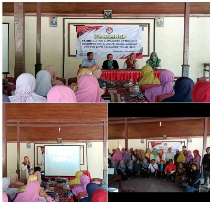
Gambar 1. Dokumentasi kegiatan pengabdian

Setelah pemaparan materi dan praktik pembukuan peserta diminta mengisi postes terkait materi yang telah disampaikan oleh tim pengabdian. Hasil postest akan dianalisa yaitu membandingkan dengan pretest untuk mengetahui sejauh mana pemahaman peserta setelah disampaikan materi.