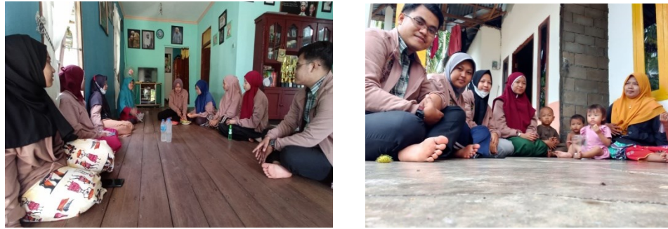
Gambar 2. Sosialisasi Moderasi Beragama dan Kesejarahan Islam