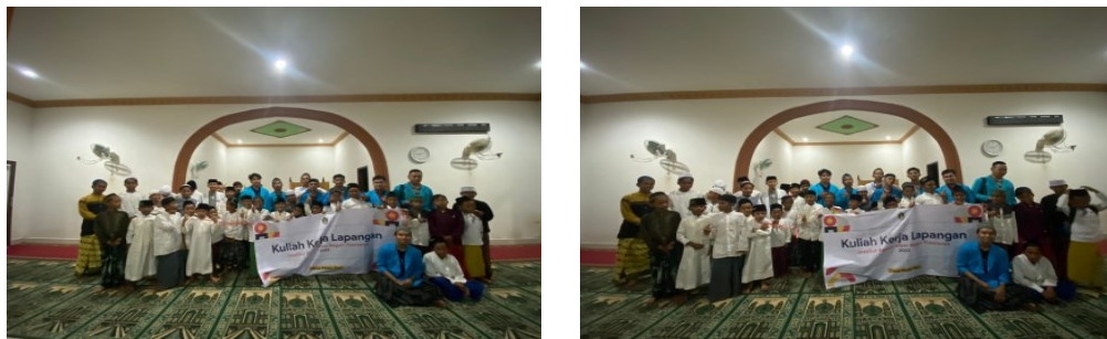
Gambar 1. Silaturahmi Bersama Pimpinan Desa dan Masyarakat

orientasi terutama kepada pimpinan desa seperti Kepala Desa, Kepala Dusun, Pimpinan Pondok Pesantren Nahdlatul Tullab As-Salafiyah, Ketua RT, Ketua RW serta tokoh masyarakat lainnya. Kemudian agar lebih membaur kedepannya dan lebih mudah untuk mendapatkan data-data yang akan digunakan sebagai penelitian yang sudah menjadi tugas bagi mahasiswa KKL. Karena dengan silaturahmi akan mampu mencairkan hubungan yang beku, sehingga akan terwujud hubungan yang harmonis. Dan untuk itulah silaturahmi perlu dilakukan karena silaturahmi merupakan bagian dari karakteristik orang yang beriman (Istianah, 2016: 206). Sebagai orang pendatang mahasiswa KKL posko Madusari harus menjalin hubungan yang dapat menciptakan keharmonisan antar sesama yang tidak memandang suku, ras, agama dan apapun itu. Sehingga tali persaudaraan tetap terjalin yang dapat menciptakan kehidupan yang moderat dan harmonis.