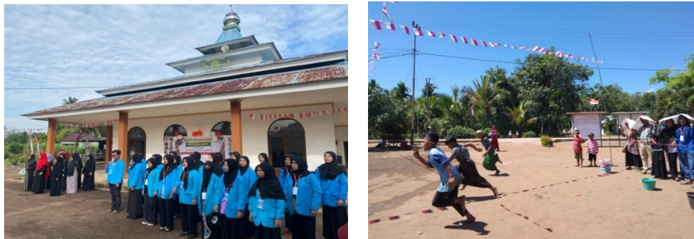
Gambar 9. Festival 17 Agustus Hari Kemerdekaan

Lomba akan dilaksanakan di setiap sore pukul 15:30 selama 3 hari berturut-turut. Karena lomba ini diprioritaskan untuk anak-anak maka sangat ramai yang mengikuti dari berbagai lomba yang ditawarkan. Untuk pengumuman juara lomba akan disampaikan pada saat malam penutupan acara pengabdian KKL ini beserta hadiah yang akan diterima oleh setiap pemenang.