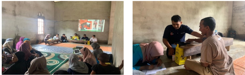
Gambar 8. Check-Up Kesehatan Gratis

Mahasiswa KKL mengundang tenaga kesehatan dari luar yang memang ahli dan bersedia untuk datang. Tepatnya pada hari Senin, 22 Agustus 2022 pemeriksaan kesehatan gratis dilakukan di rumah Ketua RT 001. Warga sangat antusias sebelum pemeriksaan di mulai warga di minta untuk mendaftarkan data pribadi dan membawa kartu identitas yaitu KTP. Sebagian besar di minati oleh ibu-ibu dan Kepala Dusun dan Ketua RW para pimpinan desa juga ikut dan mengapresiasi kegiatan ini.