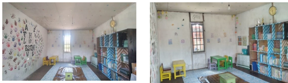
Gambar 4. Rumah Baca

Untuk itu, di setiap kelompok yang berposko di manapun dianjurkan untuk mengadakan rumah baca. Tempat yang digunakan bisa dari lokasi yang sudah ada di lingkungan setempat ataupun mengadakan sendiri. Pasokan buku dapat melalui open donasi dan pengajuan dari Departemen Agama Kalimantan Barat. Adapun jenis buku yang akan disediakan dirumah baca seperti buku agama, buku ilmu pengetahuan umum, komik, dan sebagainya. Karena bermukim di lingkungan pondok pesantren sehingga tempat yang digunakan ialah ruangan yang sebelumnya dijadikan gudang tetapi agar lebih menarik mahasiswa KKL melakukan renovasi. Ini dilakukan supaya terutama santri dan warga sekitar tertarik untuk datang dan membaca buku-buku yang telah di sediakan.