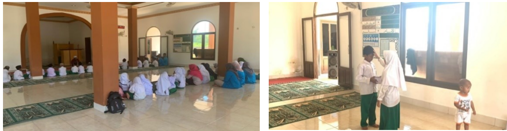
Gambar 10. Santunan Anak Yatim Piatu

kegembiraan bagi mereka yang sudah yatim, piatu ataupun yatim piatu di saat mengajar mereka di sekolah maupun pada saat mengaji.