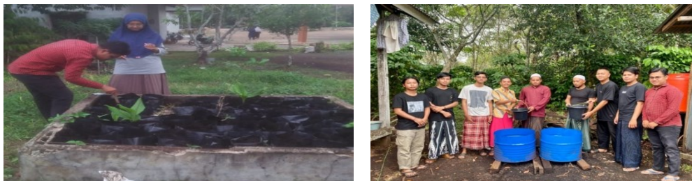
Gambar 7. Bibit Cabai dan Bibit Ikan Lele

Untuk bibit ikan lele melakukan penangkaran di lingkungan pondok pesantren. Awalnya sebuah wadah besar milk pondok pesantren yang sebelumnya digunakan ternak ikan tetapi untuk renovasi tampaknya memakan biaya yang cukup besar sehingga mahasiswa KKL belum cukup mampu untuk melakukan renovasi. Akhirnya mahasiswa KKL berinisiatif menggunakan alat seadanya sebuah tangki air besar kemudian diberi warna agar lebih menarik. Akhirnya tempat tersebut yang digunakan untuk menampung ikan lele yang akan ditenakkan. Sama seperti bibit cabai setiap hari secara bergantian mahasiswa KKL merawat dengan cara memberi pakan yaitu pellet pagi dan sore hari serta memeriksa air dan menggantinya apabila sudah cukup keruh. Kedepannya setelah KKL ini usai akan di serahkan kepada pihak pimpinan pondok pesantren Nahdlatut Tulab As-Salafiyah untuk ditenak kembali agar lebih banyak yang dibantu oleh para santri-santrinya. Sehingga ketika sudah layak untuk dijual maka akan dapat meningkatkan perekonomian pondok pesantren tersebut dan terus untuk di budidaya.