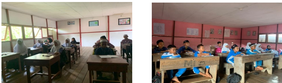
Gambar 3. Pengajaran di Sekolah

Sistem pembelajaran seperti seperti sekolah pada umumnya seperti sekolah di perkotaan. Namun, ada keunikan tersendiri sekolah di desa ini karena berada di lingkungan pondok pesantren sebelum masuk peserta didik di ajak untuk sholat dhuha terlebih dahulu setelah itu membaca surah-surah pendek Juz Amma.; Apabila lonceng berbunyi pertanda peserta didik harus masuk ke dalam kelas dan pelajaran akan segera dimulai. Jumlah peserta didik di setiap jenjang sekitar 30 hingga 35 peserta didik. Tetapi pembelajaran dengan materi keagamaan sangat diprioritaskan sehingga mahasiswa KKL ketika mengajar harus menyesuaikan dengan kultur atau budaya sekolah yang diterapkan. Namun, tidak mengesampingkan materi-materi umum yang biasanya di pelajari seperti di sekolah-sekolah perkotaan seperti matematika, seni budaya, ilmu pengetahuan sosial dan lain-lain. Pengajaran ini dilaksanakan pada pada hari Senin, Selasa, Rabu, Kamis dan Sabtu. Khusus di hari Jumat sekolah libur karena memang di hari tersebut merupakan hari libur Islam dalam setiap pekannya.