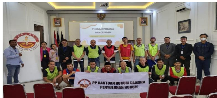
Gambar1. Dokumentasi Penyuluhan Hukum