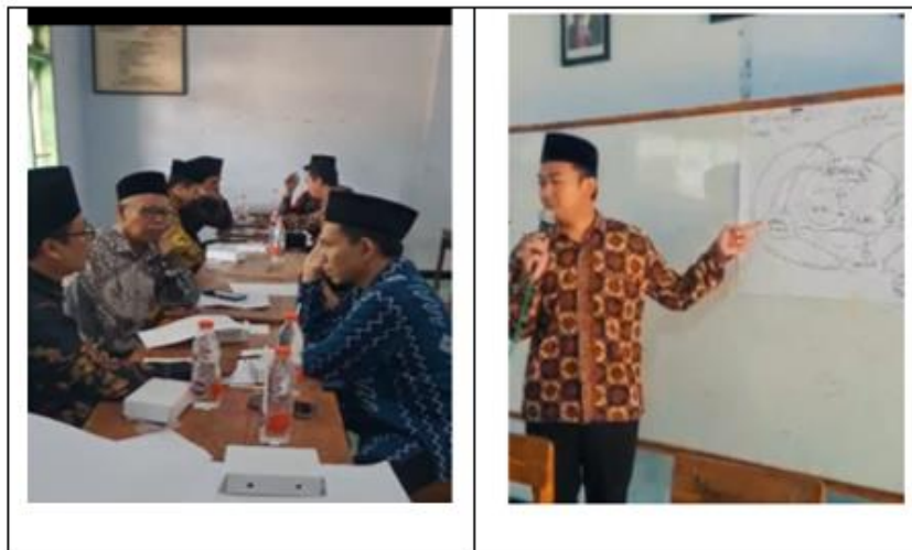
Gambar 2. Diskusi kelompok

Presentasi hasil kerja kelompok di wakili oleh pertama kelompok yang membuat diagram alur mulai dari input santri Al-Islam sampai pada output alumni yang tersebar di berbagai lembaga baik di lembaga pendidikan, lembaga swadaya masyarakat dan alumni yang melanjutkan pendidikan ke perguruan tinggi di dalam dan luar negeri. Presentasi dimaksudkan agar hasil kerja kelompok 1 bisa diberi masukan dan catatan oleh kelompok lain. Kelompok dua membahas tentang Diagram Venn yaitu menjelaskan eksistensi. Pesantren Al-Islam dalam menjalin kerja sama dan membangun jejaring sosial dengan lembaga lain baik lembaga formal maupun non formal. Dari pemaparan diketahui jejaring Pesantren Al-Islam di antaranya adalah dengan sekolah dasar, madarasah Ibtidaiyah sebagai input santri, Kanwil Kemenag, Puskesmas, Kemendikbud, lembaga pesantren lain, universitas, Ikatan wali santri dan beberapa NGO yang sering bekerja sama dengan pesantren.