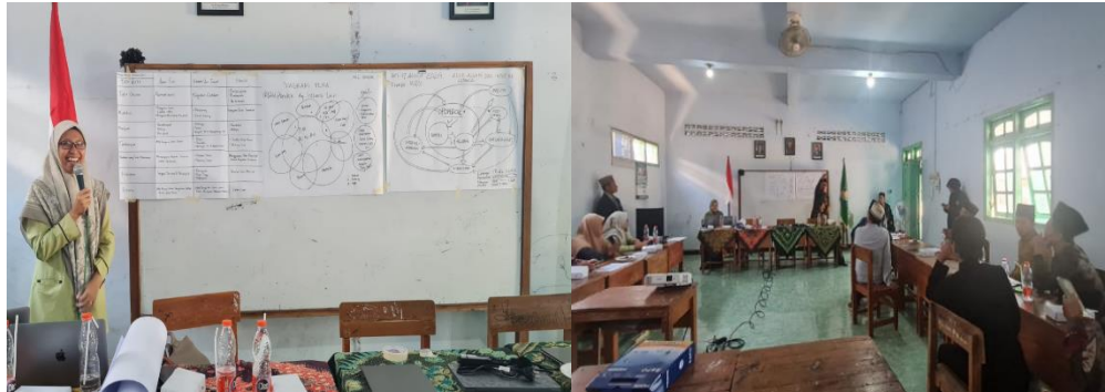
Gambar 3. Presentasi transek di lingkungan Pesantren Al-Islam

praktek simulasi ini sebagai ajang untuk menyadari kekuatan dan kekurangan bersama untuk mendapat solusi yang terbaik.