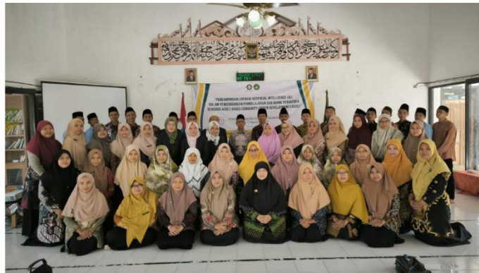
Gambar 4. Sesi foto bersama peserta pelatihan dan narasumber