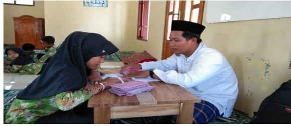
Gambar 2. Pendampingan Kegiatan Pembelajaran Bahasa Arab antara guru dengan anak didiknya.