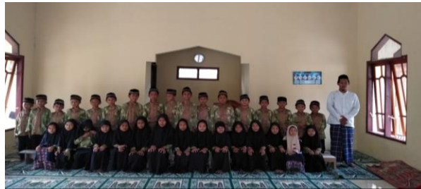
Gambar 3 kegiatan non formal Bahasa Arab oleh guru pengajar