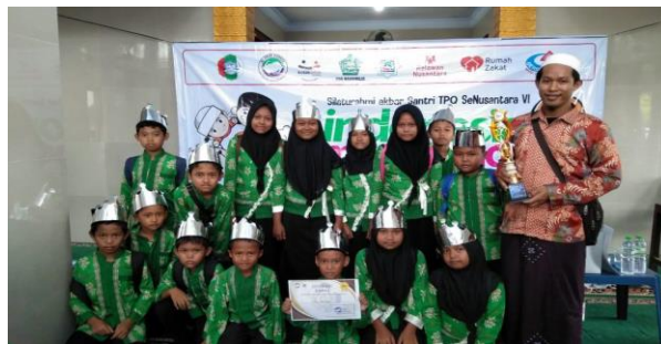
Gambar 4 Perolehan prestasi Bahasa Arab

Melalui teknik wawancara yang dilakukan penulis kepada informan mengenai pendampingan Bahasa Arab di Taman Pendidikan Al-qur'an (TPQ) dapat dilihat bagaimana anak-anak belajar dengan sungguh-sungguh dan semangat yang tinggi. Sehingga orangtua menjadi sangat berminat terhadap pendidikan non formal yang diselenggarakan Taman Pendidikan Al-Qur'an (TPQ) di Wonogiri. Prestasi dan lomba yang didapat juga meningkatkan kualitas nama baik bagi semua kalangan baik guru pengajar, Taman Pendidikan Al-qur'an (TPQ)