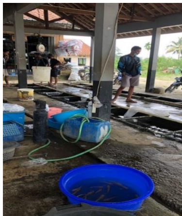
Gambar 2. Proses Take Video

Meski sebelumnya Desa Beji memang sudah memiliki citra sebagai kampung mina, namun berdasarkan reset yang dilakukan bahwa promosi yang dilakukan di media sosial masih sangat terbatas. Oleh karena itu dalam kegiatan pengabdian kali ini program yang diambil untuk membantu meningkatkan branding Desa Beji sebagai kampung mina yaitu dengan membuat video pemasaran di pasar ikan, yang nantinya di unggah ke berbagai media sosial seperti youtube dan instagram. Proses ini terbagi dalam tiga tahap.