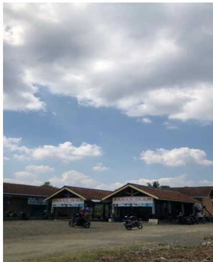
Gambar 1. Pasar Ikan

Selain hanya di jual di pasaran usaha pemasaran yang dilakukan adalah dengan memasang promosi di berbagai media sosial. Sehingga sekarang pemasaran ikan hasil para petani ini sudah sampai luar kota seperti Bogor, Kalimantan, Yogyakarta dan juga Tulungagung. Rata-rata mereka konsumen dari luar kota memesan benih ikan untuk budidaya, memang sudah tidak asing lagi jika Desa Beji sering dipilih sebagai pemasok benih ikan karena memang memiliki kualitas yang baik.