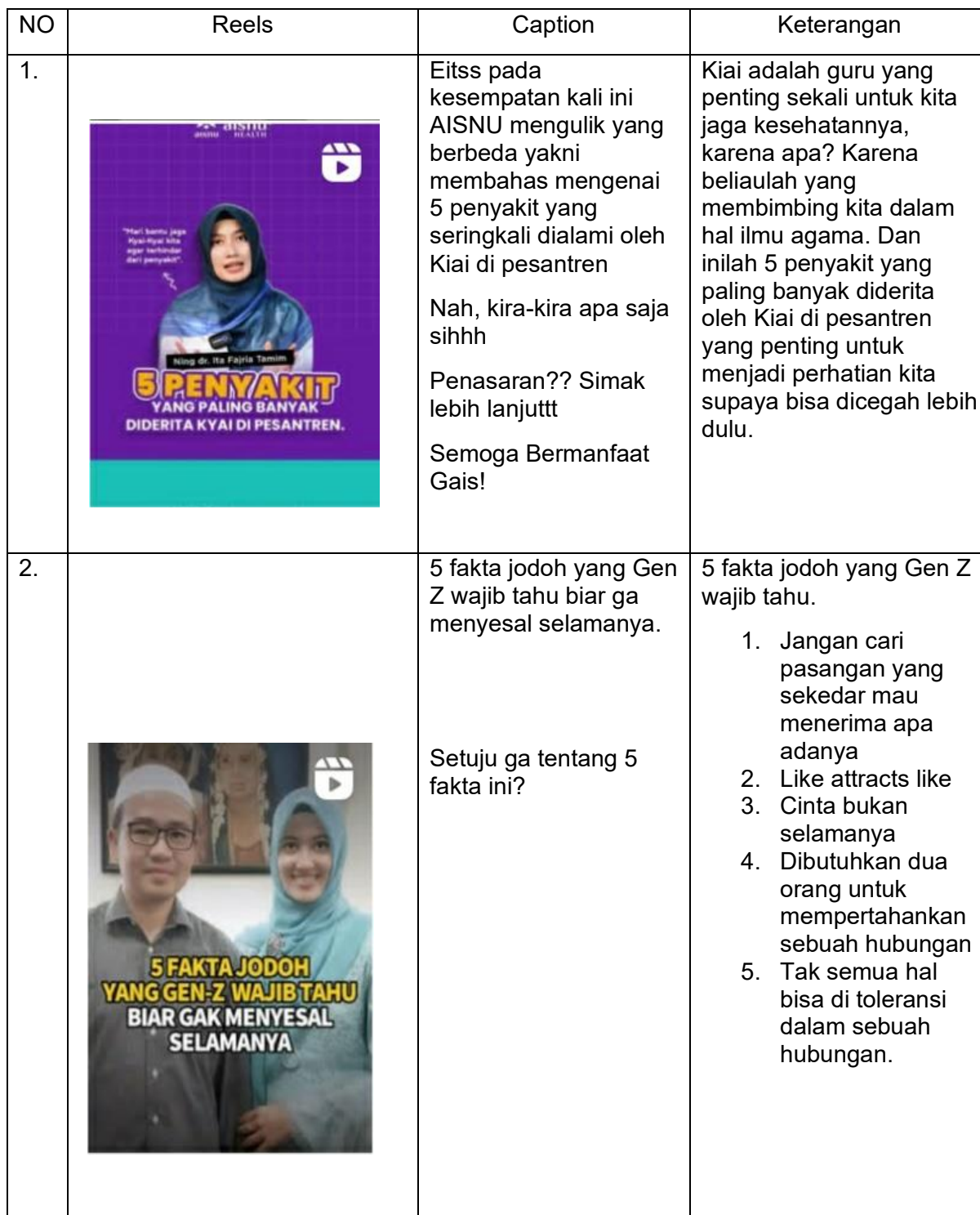
Table 2.1 Data strategi dakwah

Berikut 10 postingan reels pada akun Instagram @itafajriatamim: